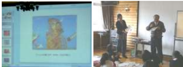
代表作「アンジェラと蒼い空」等の解説と、絵の具の使い方の指導