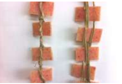
図1 便利なものを借りました