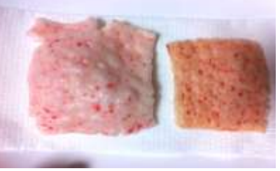
図3 薄いもちを焼いたみたい