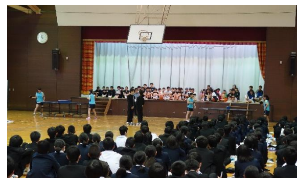
～～入学式・対面式の スナップ～