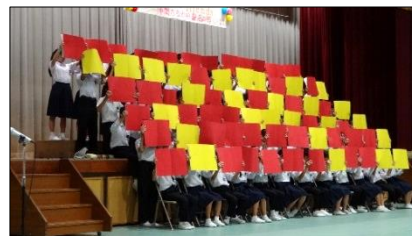
2年：マスゲームの様子

を表現してくれました。息がピッタリでとてもきれいでした。合唱もマスゲームも一人ではできないことです。まさに協力があればこそその発表でした。