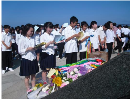
沖縄での平和学習