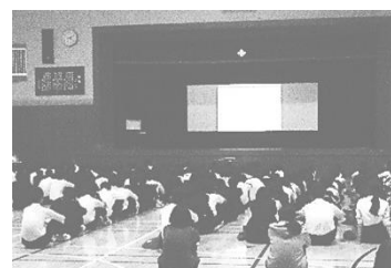
薬物乱用防止教室（10/29）